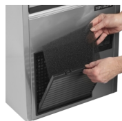
Filter de condenseur facile à nettoyer