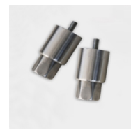
Pieds ajustables en option