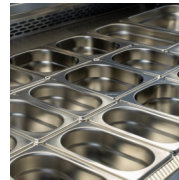
Conçu pour des bacs GN1/1, non fournis