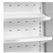
Tablettes réglables avec fonction de basculement