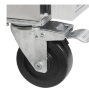
Roulettes solides en option