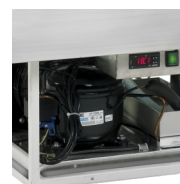
Évaporation automatique d'eau de décongélation