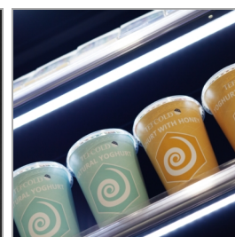
Éclairage LED sous chaque tablette