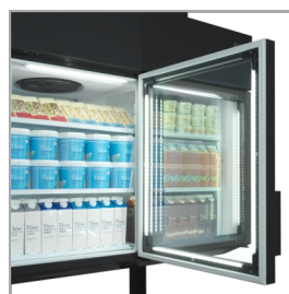
Éclairage LED dans le cadre de la porte