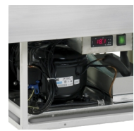
Évaporation automatique d'eau de décongélation