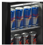
Conçu pour les canettes de boisson énergétique