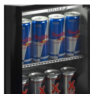
Conçu pour les canettes de boisson énergétique