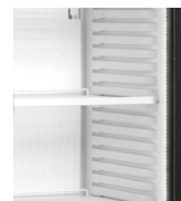
Éclairage LED dans le cadre de la porte