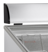
Panneau de présentation lumineux en option (accessoire)