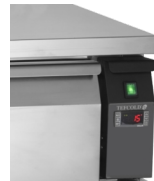
Passage de réfrigération à congélation à l'aide d'un simple bouton