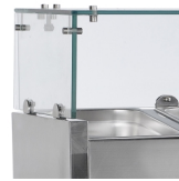
Structure en verre pour protéger les aliments