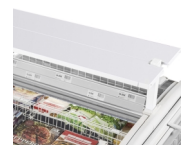
Tablette en option