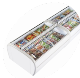
Installation en îlot